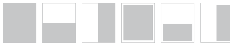
1/1 Seite 210 x 297 mm | 1/2 Seite quer 210 x 140 mm | 1/2 Seite hoch 110 x 297 mm | 1/1 Seite 180 x 273 mm | 1/2 Seite quer 165 x 130 mm | 1/2 Seite hoch 85 x 273 mm